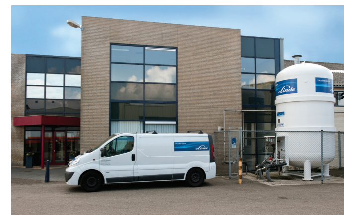
Koningskampen 5a, Hedel

De activiteiten in de cryobank omvatten het doelmatig en beheerst ontvangen, opslaan, verplaatsen, uitgeven en afvoeren van biologisch materiaal. Binnen de cryobank wordt een gestructureerd beleid gehanteerd, dat de ISO 9001:2008 norm en overige nationale en internationale regelgeving in acht neemt.